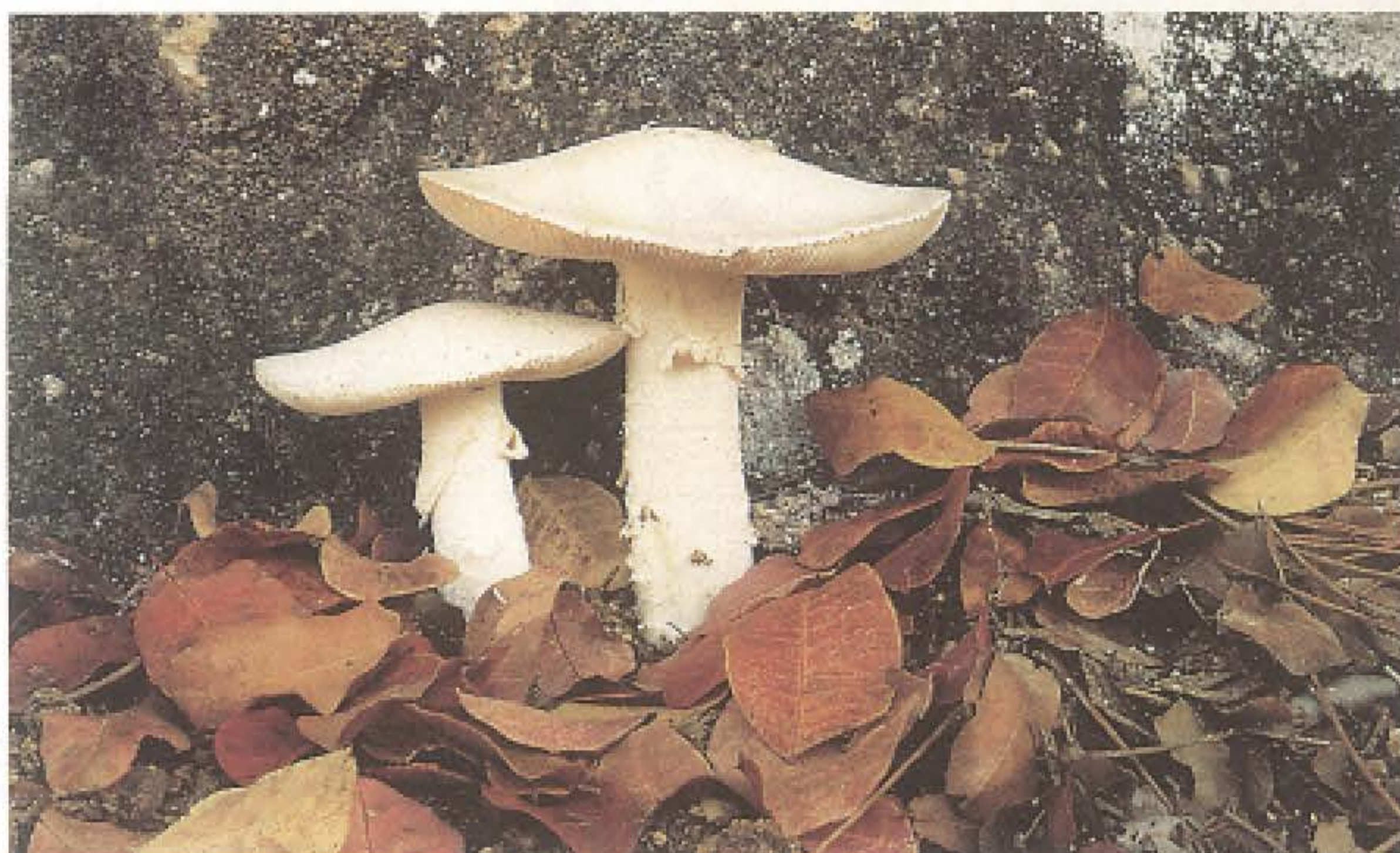
Champignons d'automne. (Photo tirée du livre «Liban terre des quatre saisons» de Ricardus M. Haber et Myrna Semaan-Haber).